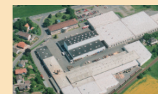
Verwaltungsgebäude und Produktions-/ Lagerhallen in Eschwege Objektanalyse, Exitstrategie, Projektsteuerung, Vermarktung