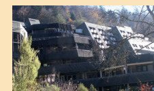
Rehaklinik in Bad Rippoldsau Objektanalyse, Exitstrategie