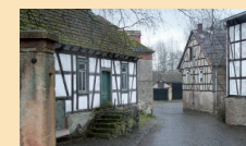
Hof Grass in Hungen Immobilienmarketing, Machbarkeitsstudie über die Implementierung einer Gastronomie