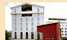
Kinkel'sche Mühle in Gießen Projektsteuerung