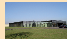
Callcenter AOK in Pohlheim Projektsteuerung, Vermarktung