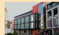
City-Center Frauentor in Görlitz Objektanalyse, Projektsteuerung, Projektfortführung