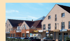
Nahversorgungszentrum und Wohnungen in Fredersdorf Objektanalyse, Exitstrategie, Projektsteuerung, Vermarktung